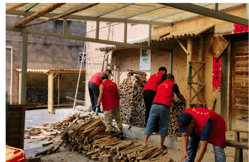
张村村和美乡村建设