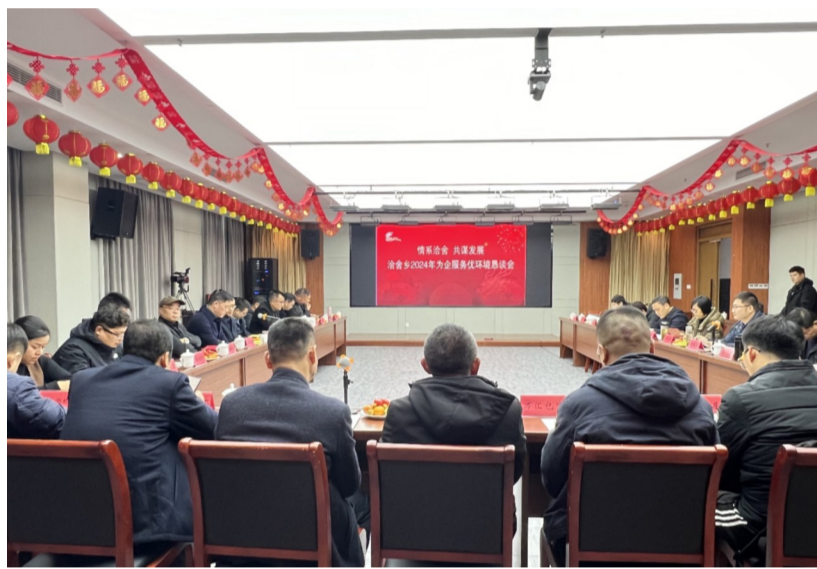
洽舍乡2024年为企服务优环境恳谈会

续推介区内优质资源,千方百计挖掘招商线索,上半年共上报有效招商信息16条,会同区直部门外出招商6次,前往合肥、上海、杭州、萧山、芜湖等地拜访客商,考察企业,充分了解企业实际需求,推介合适地块、厂房,力促项目落地。在具体操作上,该乡围绕全区三大主导产业和园区规划布局,借助智能制造科创产业园、城东标准化厂房、丰乐大厦、绿色食品产业园等载体平台,鼓励推介上下游企业和合作伙伴前来投资兴业,形成产业集群效应;聚焦招商线索,建立乡招商引资项目库,落实周调度,实时更新线索,分类分阶段推进各类项目,确保招商引资“不断链”、项目洽谈“不掉线”,推动项目落地落实。上半年,全乡共落地美仑国际、天伊金属等亿元项目4个,到位资金6.4亿元;以“每天都是节点、全年都在攻坚”的态度和干劲,始终把优化营商环境作为“永不竣工的工程”,积极主动靠前服务政务审批、信贷融资、用地用电等事宜,及时解决企业诉求,争当“金牌小二”“五星勤务员”,全力营造人人都重视营商环境、时时处处都讲营商环境的良好生态。上半年,该乡累计走访企业100余次,收集企业诉求9条,办结率100%。