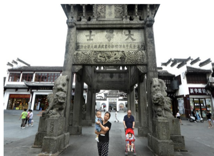
许国石坊跨街而立