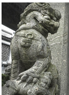
许国石坊上有12只大石狮