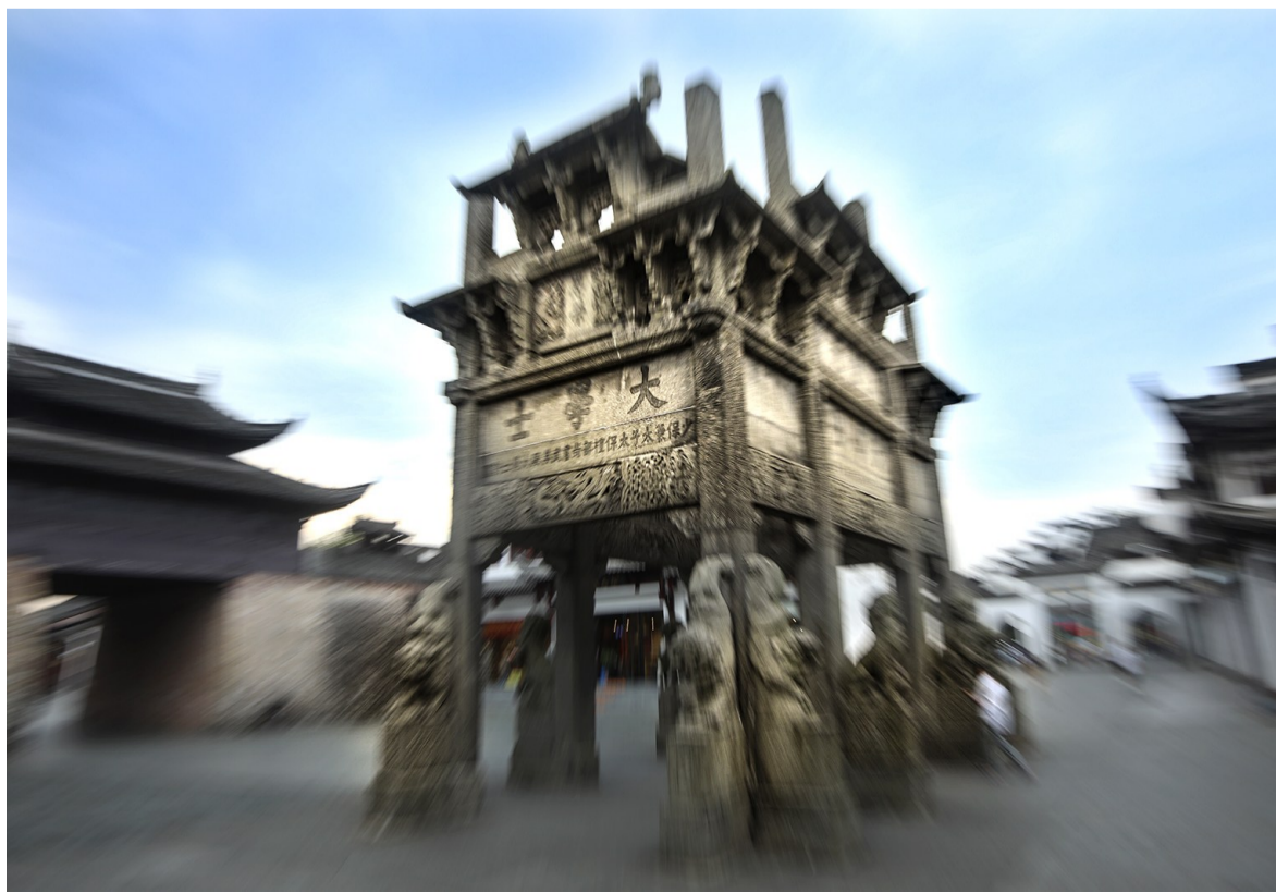
中国现存唯一八脚牌坊,距今已有400多年

许国石坊,又名大学士坊,俗称“八脚牌楼”。位于歙县徽州府衙阳和门东侧,跨街而立,为明万历十二年十月(公元1584年)朝廷旌表歙县人许国衣锦还乡而立。1988年列入第八批全国重点文物保护单位。 许国石坊为八柱牌坊,是中国现存唯一的一座八脚牌坊,是古徽州标志性建筑。许国石坊是封建社会为旌表功勋、科第、德政以及忠孝节义所立的建筑,是中国古代历史文化的载体,综合体现了石坊建造技艺的最高水平。 史料记载,许国石坊是仿木构造建筑,整个牌坊由前后两座三间四柱三楼和左右两侧单间双柱(前后两坊合用)三楼的牌坊组合而成。八根柱子各为0.5米见方、7