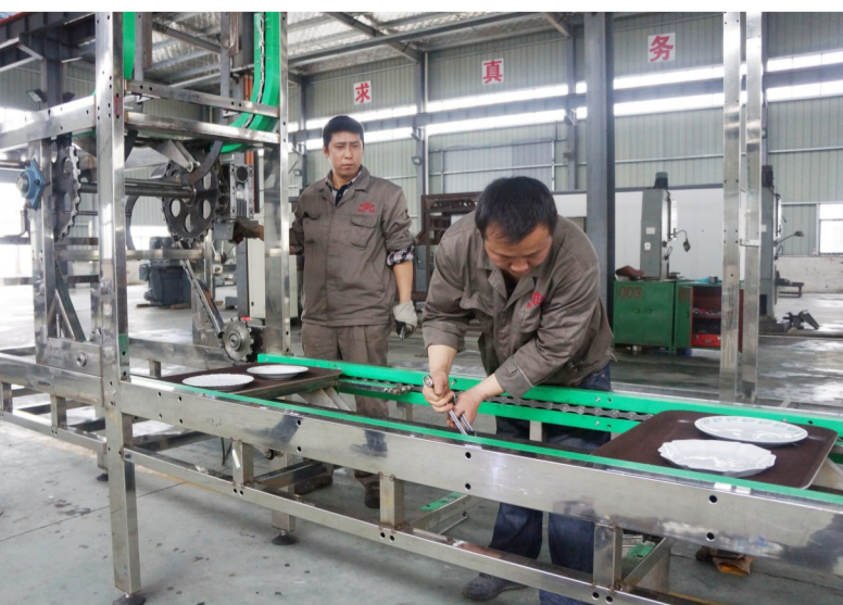
位于屯溪区九龙低碳经济园区的黄山鼎奇传动有限公司，加快企业创新步伐，针对市场需求，研制生产了餐饮菜肴食品输送机，并于去年底获得两项发明专利，现产品已销售我市各大餐饮企业，深受好评。图为3月18日，工人在调试输送机。

近日，休宁县板桥乡林业部门对全乡历史悠久的名贵树种进行全面挂牌保护，使这些名贵古树有了“身份证”。其中位于该乡板桥村黄连村民组的一棵红豆杉树龄已达千年以上。