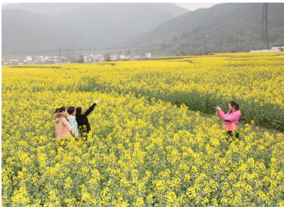
3月20日，笔者在黟县碧阳镇丰梧村看到，一大片油菜花分布在田间，把整个大地装扮成一片迷人的花海。