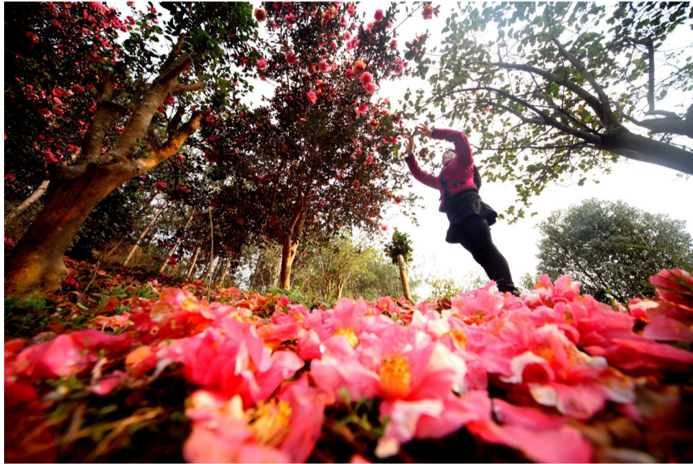
3月19日，徽州区茶花生态文化园内，游客在拍茶花发微信。茶花生态文化园占地3500亩，千株茶花同时盛开，吸引不少游客前来观赏。

据了解，玉兰原产于长江流域，我市三区四县均有野生玉兰生长。唐代诗人王维有诗写道：“木末芙蓉花，山中发红萼。”诗中的“红萼”指的就是红玉兰。在这生机勃勃的春光里，让我们一起赏花去。