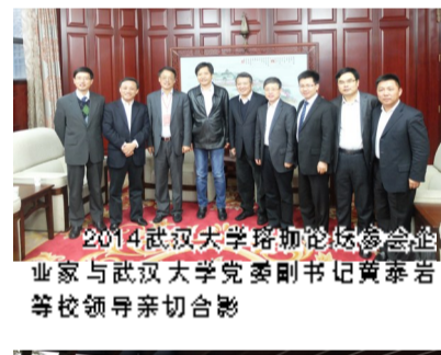
2014武汉大学珞珈论坛参会企业家与武汉大学党委书记黄泰岩等校领导亲切合影

千里之行,始于足下。新生的艾登医疗中心能否健康发展,直接决定着“大医疗”计划能否顺利迈出第一步。为迅速打开市场,艾登经营团队创新性地运用“渠道