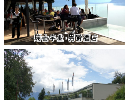
瑞士艾登医疗中心