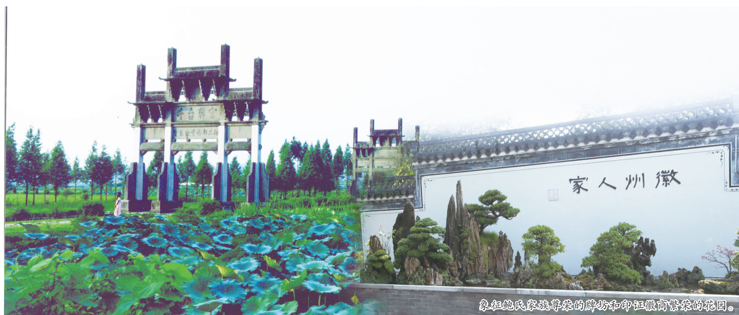
象征地家族繁荣的牌坊和印钮徽商繁荣的花园。

统一往返发车时间上午为：8:00、9:00、10:00、11:00，下午为：13:00、14:00、15:00、16:00。