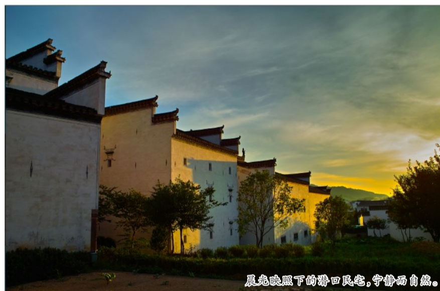
晨曦映照下的潜口民宅，宁静而自然。