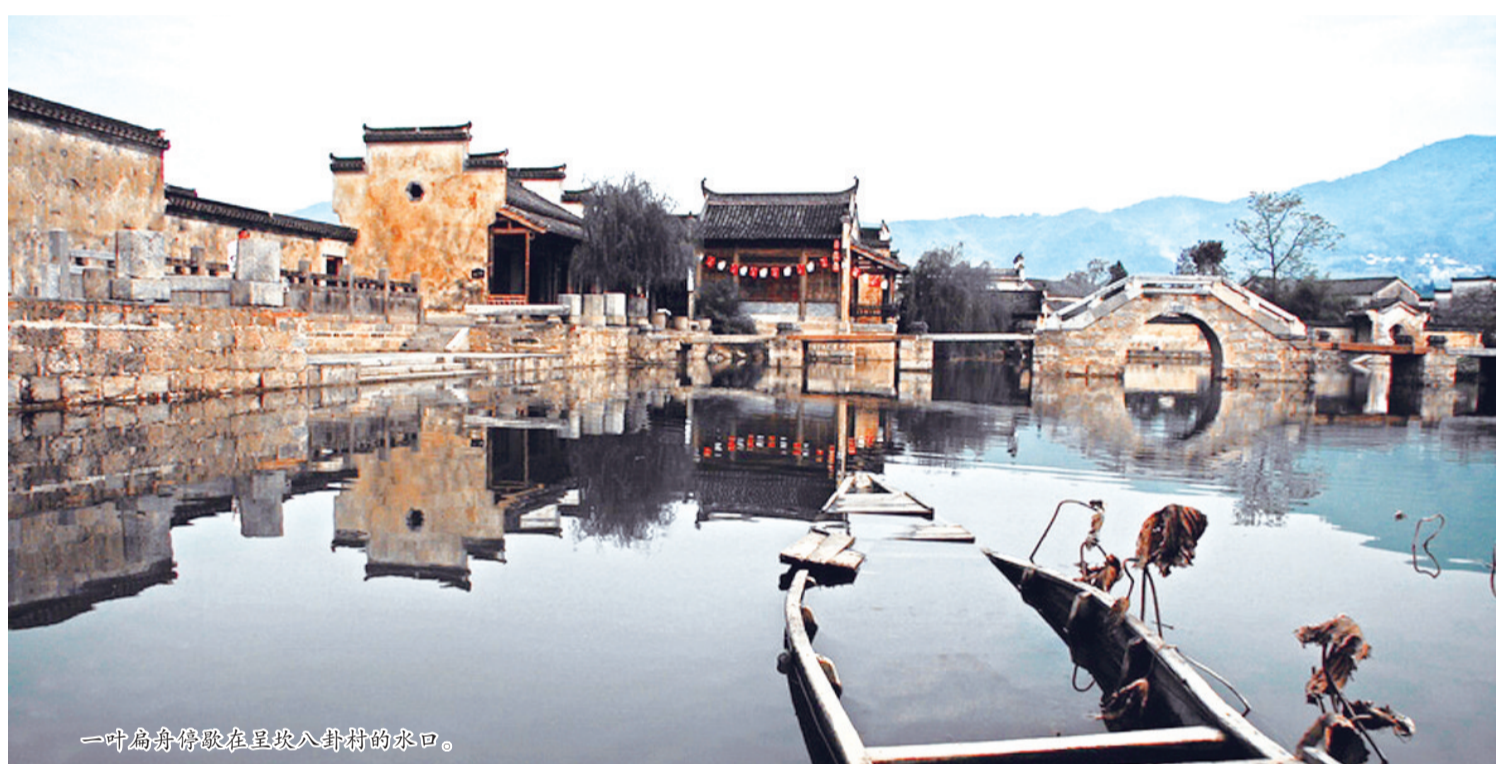
一叶扁舟停歇在呈坎八卦村的水口。

我们的寻梦之旅也在这“全村同在画中居”的地方落下帷幕，古徽州保持着淡泊宁静的节奏，让我们忘却了时间，恍如隔世。