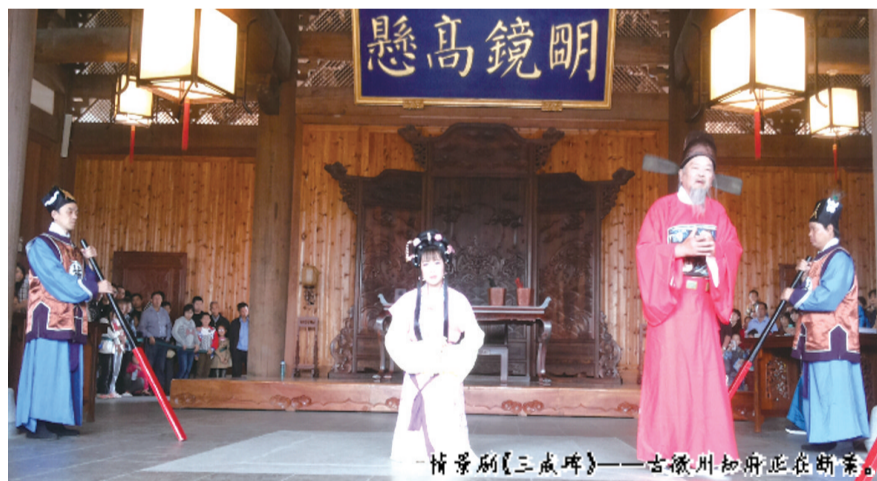
情景剧《三戒碑》——古徽州新游正在新棠。