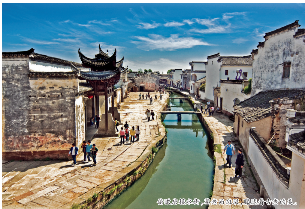
俯瞰唐模水街，苍老而斑驳，散发着古老的美。