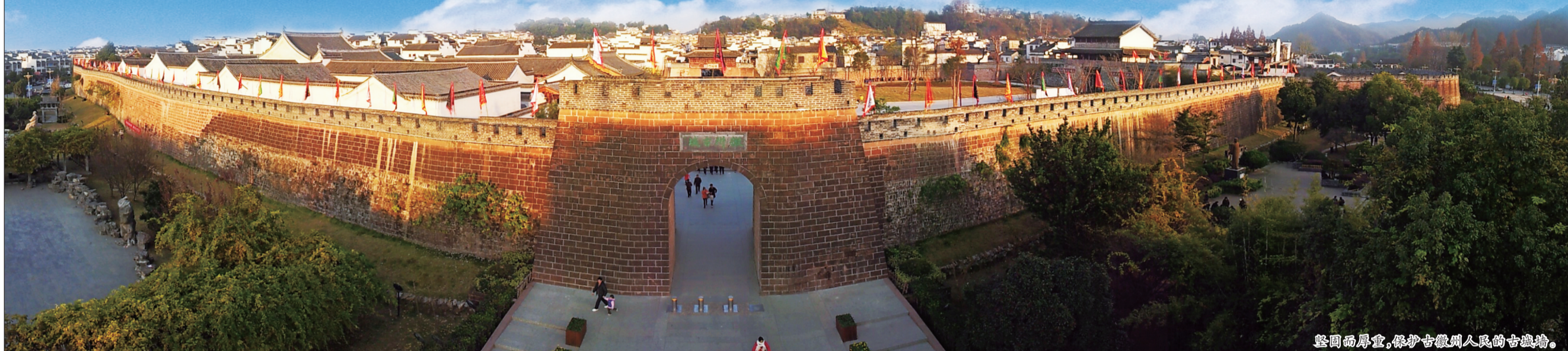
坚固而厚重，保护古徽州人民的古城墙。

初秋的风让人清醒，雨让人感悟。初秋时节，走进古徽州文化旅游区，穿行在文化厚重浓郁的古城、古村、民宅，从视觉到感官，都能品味到古徽州之美。带着对古徽州独有的情怀感悟，我们的寻梦之旅就这样开始了。