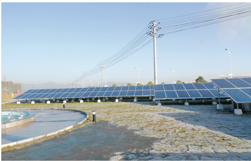
正国太阳能示范电站

2010年12月31日,市委书记、市人大常委会主任王福宏,市委副书记、市长宋国权率队在经济开发区继续开展观摩。观摩团一行首先参观了服务业配套项目——汽贸中心。新城汽车贸易中心项目坐落于开发区梅林大道和枫树路之间,占地约115亩,集中发展汽车贸易产业,形成集新车销售、检测、维修、美容、零配件销售为一体的汽车贸易中心。目前已有奇瑞、东风悦达起亚、江淮、别克、雪佛兰等4家汽车公司的6个4S店入驻。二期将规划建设7-8家汽车4S店,届时将建成我市规模最大的汽车贸易服务中心。